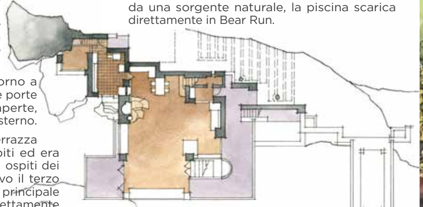
PLANIMETRIA PRIMO PIANO